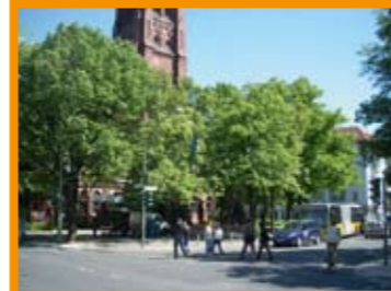
Thusneldaallee: Soll sie für den Autoverkehr gesperrt werden? Wird eine bessere Anbindung des Westfälischen Viertels an die Turmstraße gebraucht?