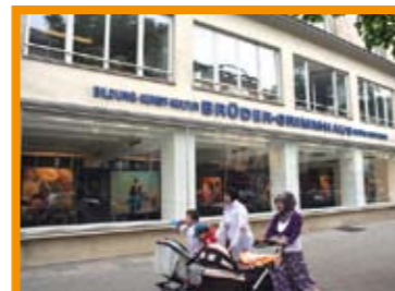
Moabit: Die sozialen Probleme sind offensichtlich. Was kann das „Aktive Stadtzentrum“ z. B. Kindern und Jugendlichen bieten? "