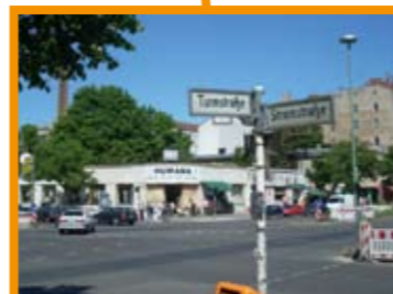
Turmstraße: Werden Bus- und Fahrradstreifen gebraucht? Wo sollen Fahrradbügel und Zebrastreifen eingerichtet werden? "