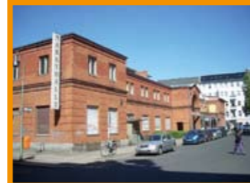
Markthalle: Wie kann sie aus dem Dornröschenschlaf geküsst werden? Soll die Arminiusstraße zur Piazza werden?