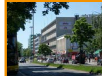
Geschäftsstraßenmanagement: Wie kann in der Turmstraße wieder ein vielfältiger Einzelhandel angesiedelt werden? "