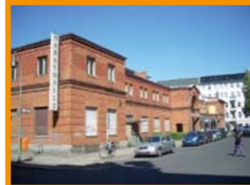
Markthalle: Wie kann sie aus dem Dornröschenschlaf geküsst werden? Soll die Arminiusstraße zur Piazza werden?